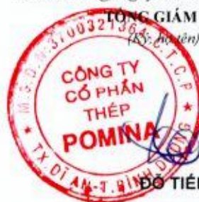
ĐO TIẾN SĨ