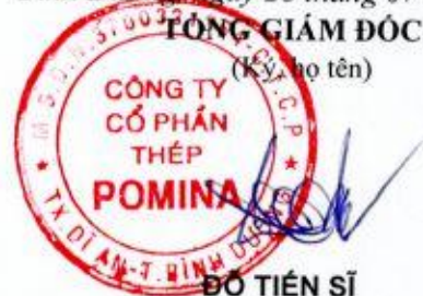
ĐÓ TIẾN SĨ